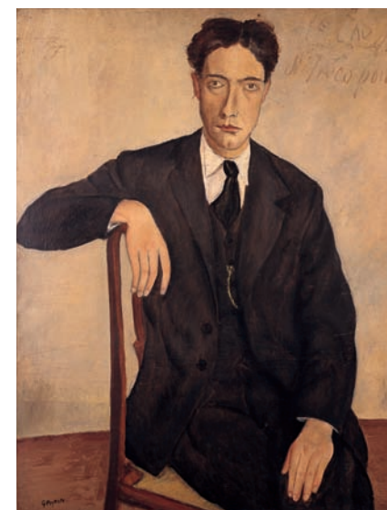
Guido Peyron, Ritratto di Luigi Dallapiccola. "Le Laudi di Jacopone", 1929