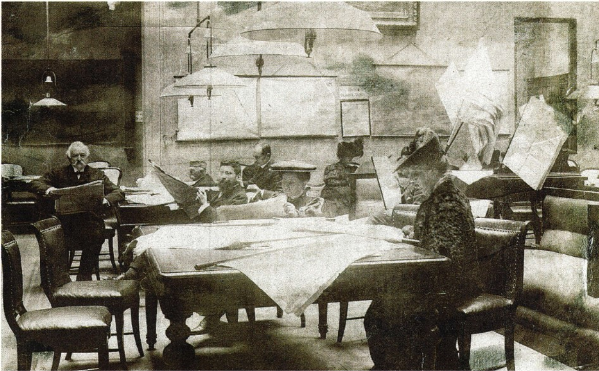
Archivio Il lettori del Gabinetto Vieusseux in una immagine di fine Ottocento (Archivio Vieusseux)

ARTICOLO NON CEDIBILE AD ALTRI AD USO ESCLUSIVO DEL CLIENTE CHE LO RICEVE - L.1626 - T.1626