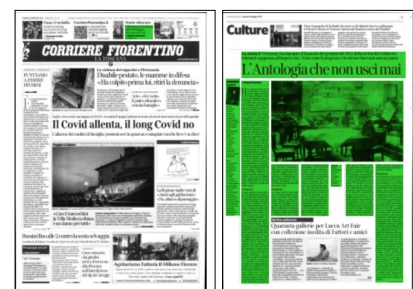
Superficie 73 %

mestrale avrebbe evitato di assumere i caratteri di un giornale scientifico in senso stretto o le cadenze di un periodico «strettamente letterario». Si trattava di forgiare uno strumento sempre più utile e attento alle applicazioni pratiche e alle necessità dell'industria, sì da rendere fruttuosa la fatica del popolo ed elevare la «civiltà dei costumi». Il tutto per un benefico Progresso, concetto scritto in maiuscolo e asse portante di tutti gli sforzi. La prospettiva non placò timori ingigantiti dagli insistiti attacchi di malevole testate ultrareazionarie quali La Voce della Verità di Modena (1831-1841) e La Voce della Ragione (1832-1835) di Pesaro, dominata dal furore restaurativo di Monaldo Leopardi. Il quale salutò con sarcasmo la finaccia dell' Antologia , accomunandola ai fogli che propagandavano i «semi malvagi dell'errore». L'ideologia del Progresso della quale l' Antologia si faceva bandiera, non fu unidirezionale. Nell'attitudine del regista progredire significava avanzare in scoperte e soluzioni in grado di assicurare a tutti maggior benessere. E non esigeva l'adesione conformista ad un dogmatico credo. Il coinvolgimento di autori di differenti impostazioni lo dimostra a iosa: da Giuseppe Montani a Niccolò Tommaseo, da Pietro Giordani a Cosimo Ridolfi, da Enrico Mayer al ginevrino Jean Charles Léonard Simonde de Sismondi innamorato delle re-